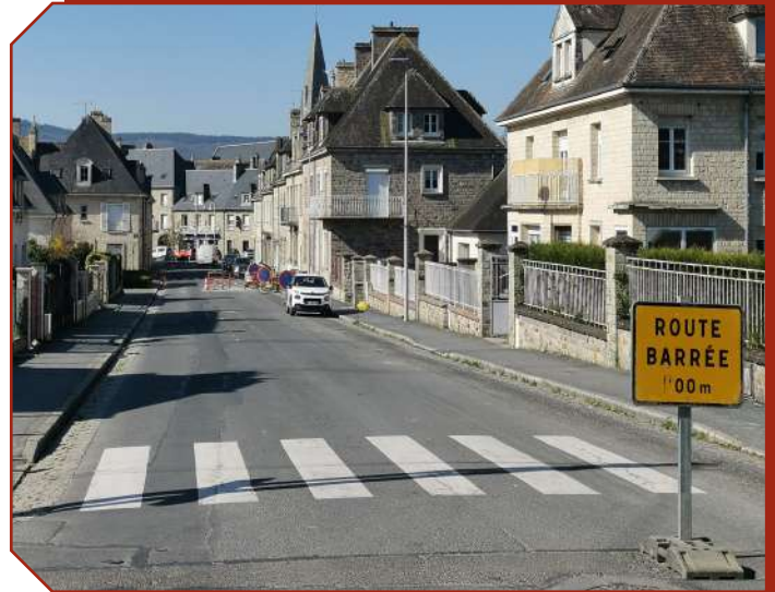
Photographie de la rue de Caen - Mairie des Monts d'Aunay

La commune s'est engagée depuis 2020 dans le label régional Ville Patrimoine de la reconstruction en Normandie. Plusieurs actions ont été conduites à ce titre, comme la réalisation d'une exposition, la diffusion d'une plaquette d'information sur le patrimoine ou encore des travaux de réhabilitation dans le respect de ce patrimoine, à l'école élémentaire par exemple. Afin d'accroître la connaissance sur ce patrimoine, la commune a réalisé en partenariat avec l'Office du Tourisme Pays de Vire Collines de Normandie, des panneaux d'information. Installés au printemps, ils permettent de cheminer dans la commune en comprenant son histoire et en découvrant des images d'Aunay-sur-Odon, avant et pendant la reconstruction. Des QR codes sont présents sur chaque panneau, avec d'autres photos ou archives. Le montant de cette action s'élève à 8 059,56€ TTC, l'Office du Tourisme a financé le projet à 85%.