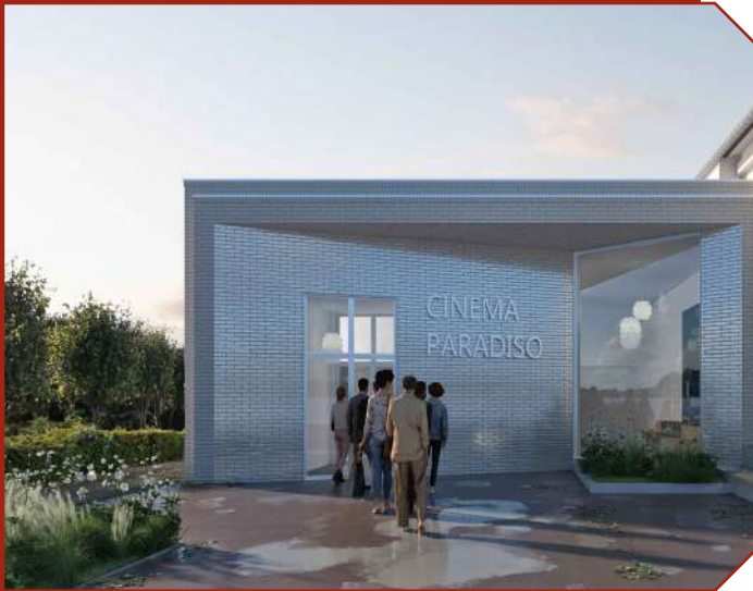
Insertion du projet - ATELIER L2 Architectes et scénographes