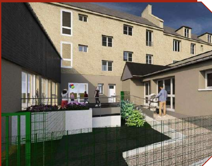
Insertion du projet - BOO' ARCHITECTURE

Le budget prévisionnel de l'ensemble du projet s'élève à 761 230€ avec un reste à charge de 32,4%. La commune bénéficie du soutien de l'Etat, avec le Fonds Vert, et de la CAF du Calvados en collaboration avec la PMI.