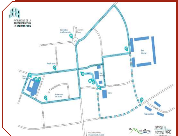
Plan du parcours reconstruction - Mairie des Monts d'Aunay

Ces travaux d'envergure s'inscrivent dans une démarche globale de réflexion des mobilités pour la commune. En effet, cette nouvelle voie sera sécurisée pour les piétons et les vélos entre le centre-ville et les équipements sportifs ainsi que la Frange Nord.