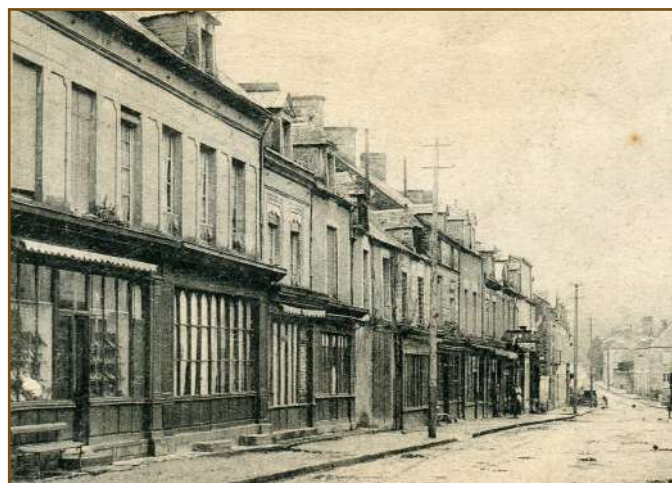
Rue d'Harcourt