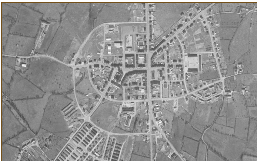
Vue aérienne Aunay-sur-Odon reconstruit (entre 1953 et 1954)