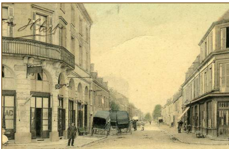
Rue de Villers