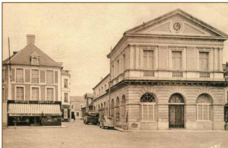
L'hôtel de ville d'Aunay-sur-Odon 1929

déjà un village commerçant et agricole. Environ 1700 personnes habitaient à Aunay-sur-Odon, et participaient aux événements de la commune, reconnus dans la région comme la foire aux poulains, le carnaval ou encore la fête Notre-Dame.