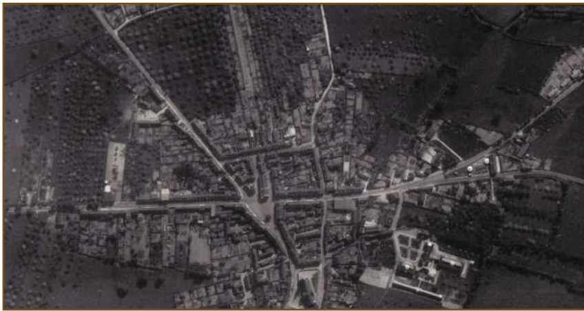
Vue aérienne avant les bombardements de 1944