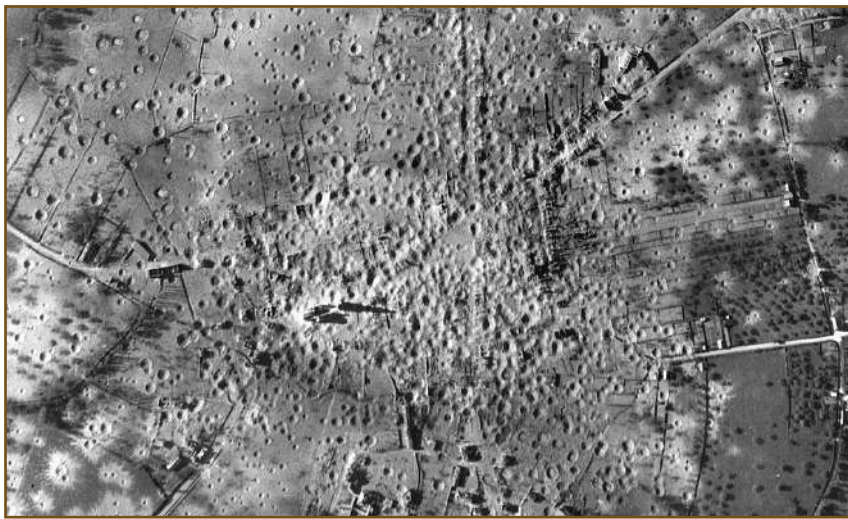
Vue aérienne après 6500 tonnes de bombes 15 juin 1944