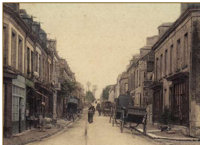
Rue de Caen